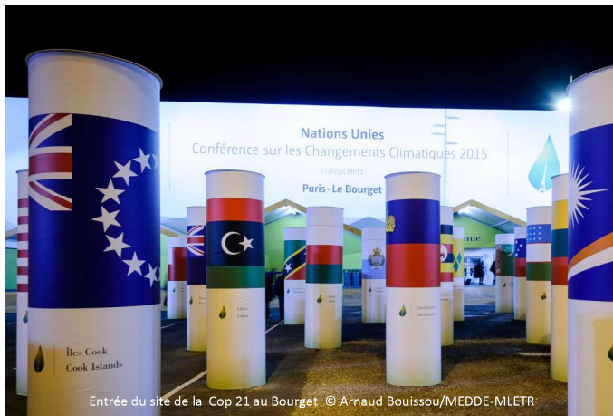
Entrée du site de la Cop 21 au Bourget.

Le 12 décembre 2015, les 195 parties ont adopté l'Accord de Paris, se donnant l'objectif de limiter l'élévation des températures en dessous de 2°C. Les États s'engagent à émettre des émissions nettes équivalentes à zéro à partir de 2050 et à sortir progressivement des énergies fossiles.