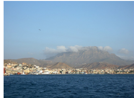
Ville de Mindelo