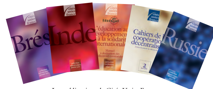
Les publications de Cités Unies France

Tout adhérent de Cités Unies France est, ipso facto, membre de l'organisation mondiale de collectivités territoriales, Cités et Gouvernements Locaux Unis (CGLU), installée à Barcelone. CGLU a été créé en 2004 et est aujourd'hui reconnu par les instances multilatérales comme les « Nations Unies des pouvoirs locaux ».