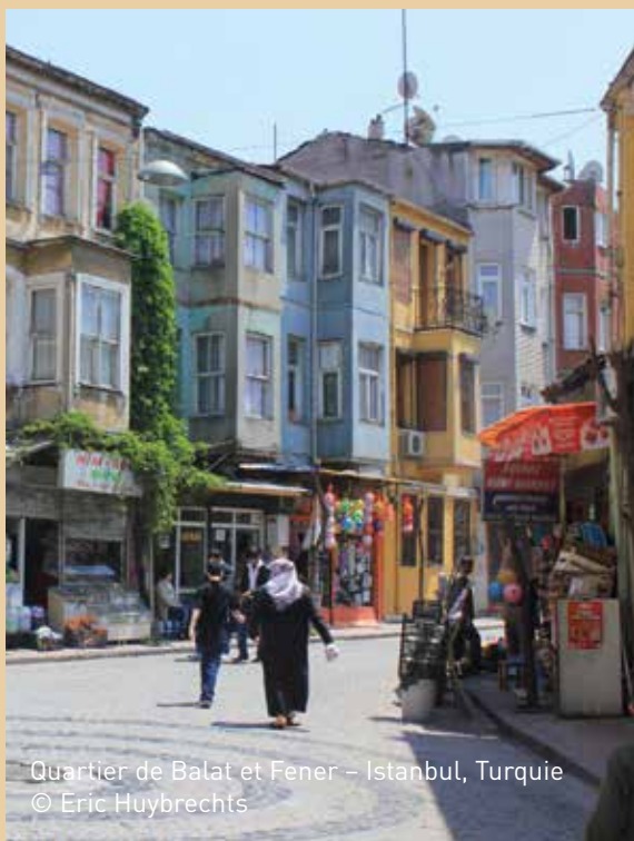
Quartier de Balat et Fener – Istanbul, Turquie