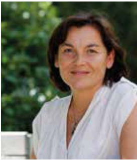
Annick Girardin Secrétaire d'État au Développement et à la Francophonie, auprès du ministre des Affaires étrangères et du Développement international