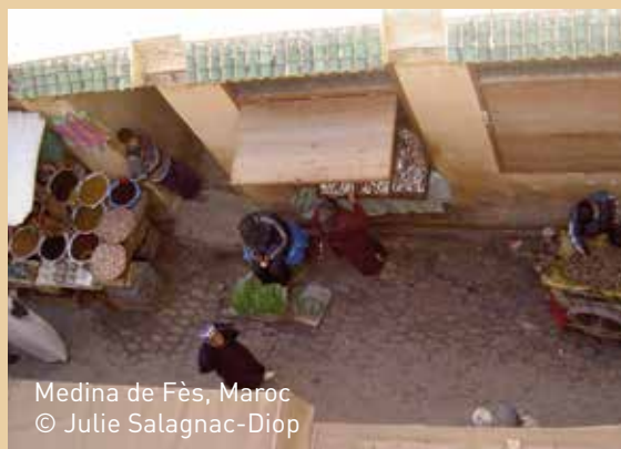
Medina de Fès, Maroc