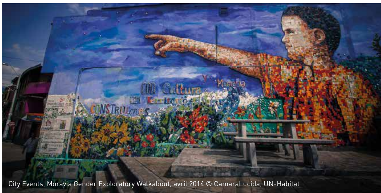
City Events, Moravia Gender Exploratory Walkabout, avril 2014

Les défis relatifs à la culture et au patrimoine portent sur la vision même de la ville, lieu d'échanges et de créations, sur sa conception, le respect de la diversité des cultures urbaines des pays. Une ville durable affirme le principe de l'unité territoriale, le refus des frontières et des segmentations. Tout ce qui est culture est, par définition, par nécessité, irrigation complète et profonde des territoires. Il est nécessaire que ces affirmations se traduisent par des textes législatifs et réglementaires mais aussi par des engagements en faveur d'un développement et d'un aménagement du territoire équilibrés qui limitent les trop fortes concentrations et l'abandon des tissus traditionnels du monde rural et des villes petites et moyennes où les liens sociaux et culturels existent de longue date et sont des biens précieux à maintenir. Il en va de même pour les nombreux centres historiques et quartiers des agglomérations, lieux de patrimoine, de création, de mémoire qui sont en péril et trop souvent ignorés.