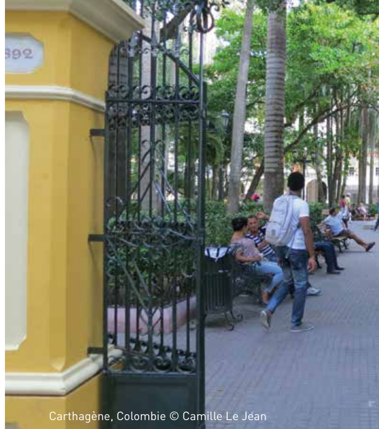
Cartagène, Colombie

Dans ce contexte, de nouveaux défis émergent et portent en priorité sur la façon de donner du sens à notre cadre de vie en société, avec le souci de créer des villes attractives, vivantes, inclusives, dans lesquelles la mixité sociale et les valeurs culturelles et citoyennes sont mieux prises en compte. Cette demande est particulièrement forte dans nos sociétés contemporaines caractérisées par une diversification et une interpénétration des cultures, liées notamment à la mondialisation et aux flux migratoires. Penser les projets urbains sous le prisme culturel permet alors d'apporter des réponses à ces enjeux en termes de requalification symbolique