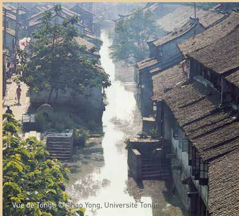
Vue de Tongli

La métropole de Shanghai connaît une croissance accélérée, avec une forte densité de population. Son patrimoine complexe et les profondes mutations qu'elle traverse en ont fait depuis les années 1990 une ville d'expérimentations en matière d'urbanisme. La méthodologie