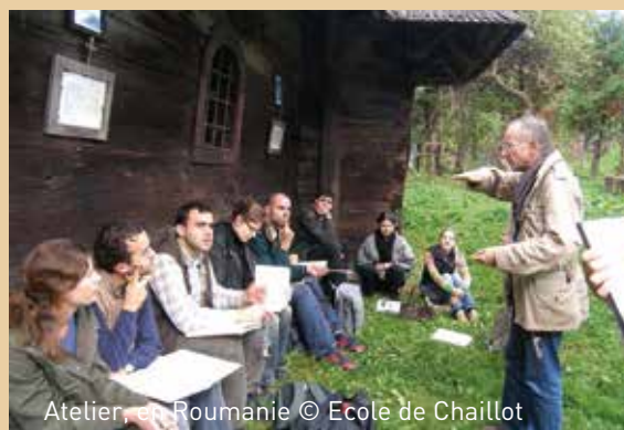
Atelier en Roumanie

avec le soutien du ministère des Affaires étrangères et du Développement international, du ministère de la Culture et de la Communication, de l'Unesco, ainsi que des Ambassades de France au Cambodge, Laos, et au Vietnam. Ce centre a pour but de former des professionnels cambodgiens, vietnamiens et laotiens à la maîtrise d'ouvrage, la maîtrise d'œuvre et la gestion administrative du patrimoine. Des professeurs de l'École de Chaillot sont intervenus aux côtés d'autres experts lors de trois sessions de formation de 2007 à 2010, lors desquelles 63 élèves ont été formés et 50 certifiés. Depuis 2012, pour aller plus loin dans la transmission du savoir-faire français en matière de patrimoine, l'objectif est désormais de former des formateurs locaux et ainsi de disposer à terme d'un corps de techniciens et d'experts du patrimoine cambodgiens, vietnamiens et laotiens.