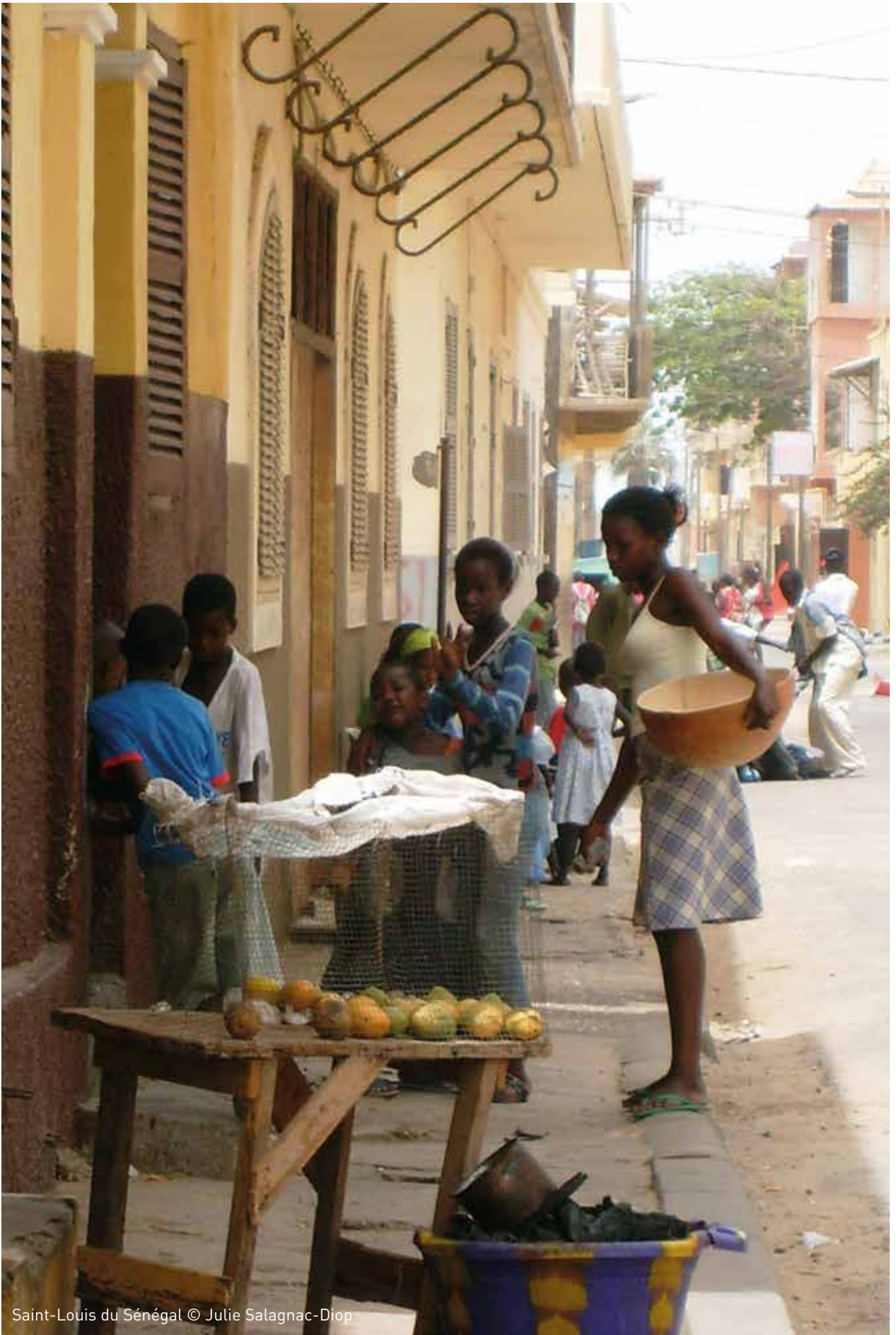
Saint-Louis du Sénégal