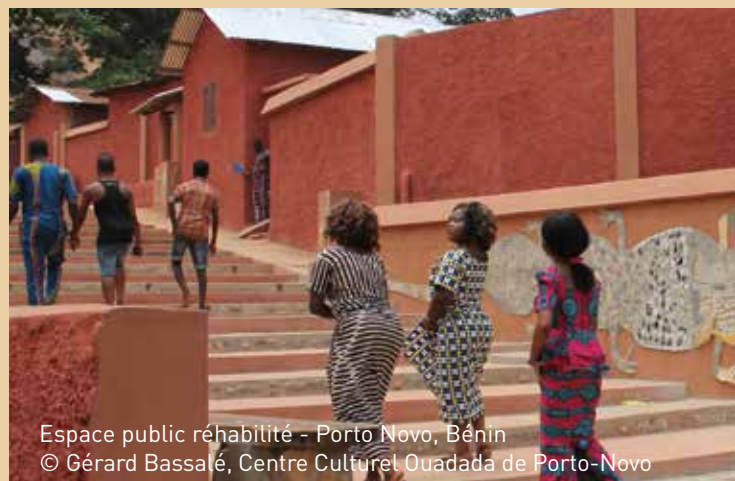
Espace public réhabilité - Porto Novo, Bénin

Cette tendance forte se caractérise par une perception nouvelle de la culture et du patrimoine comme la volonté de « passer d'une protection du patrimoine statique, visant des objets, fondée sur la notion d'inventaire, à une protection dynamique, structurelle, ancrée dans la vie quotidienne... ». Le patrimoine urbain doit désormais se concevoir comme « un champ d'expériences incitatif, un espace d'apprentissage à l'invention de nouveaux espaces de proximité tant pour les praticiens que pour les usagers 2 ».