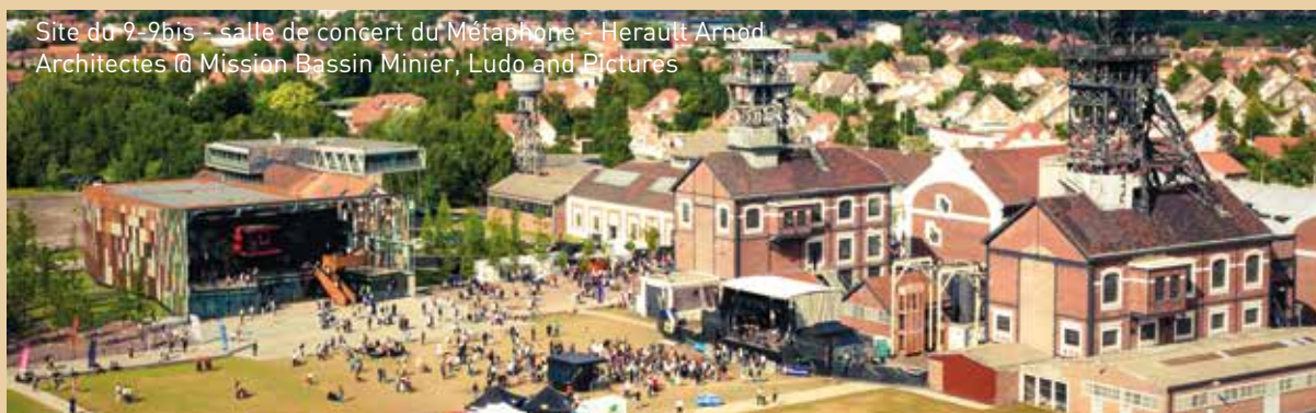
Site du 9-9bis - salle de concert du Métaphone - Hervault Arnod Architectes @ Mission Bassin Minier, Ludo and Pictures

En revitalisant les quartiers historiques, et plus largement en donnant une place à la culture dans la ville, les autorités locales témoignent de leur volonté politique de prendre en compte le patrimoine comme un bien collectif au service du projet urbain.