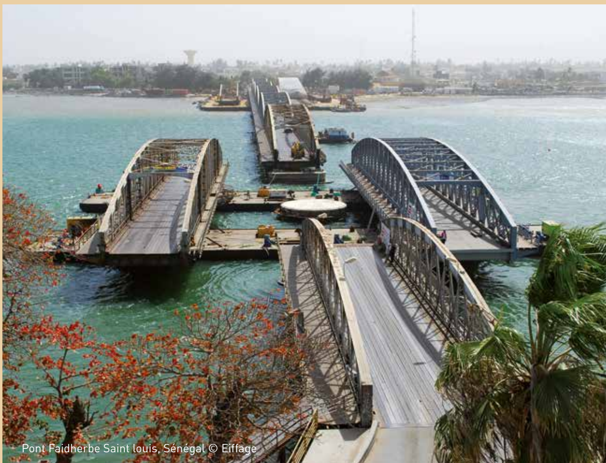
Pont Faidherbe Saint Louis, Sénégal