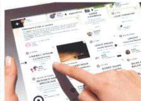
Cette nouvelle plateforme de services, qui se déploiera sur le territoire de l'intercommunalité, a reçu un financement de SMO.

Ainsi, on pourra y échanger entre voisins des services - gardes d'enfants, soutien scolaire, covoiturage... - y trouver l'agenda et les manifestations proposées par les collectivités, les entreprises ou des associations du territoire, ou l'information en temps réel, comme l'incidence des transports en commun. « Si l'on a besoin d'un covoiturage à la sortie de l'école vers la bibliothèque, on peut envoyer un message,